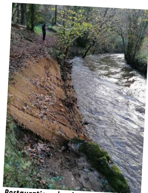
Restauration des berges du Jaudy à Kerizel par Guingamp Paimpol Agglomération - Septembre