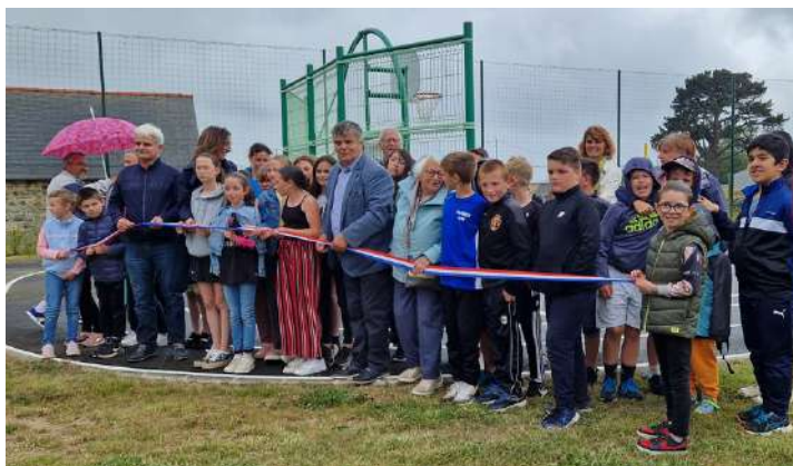
Le 30 juin Inauguration de l'espace intergénérationnel