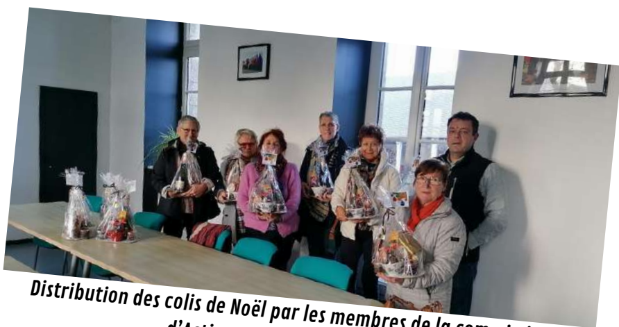
Distribution des colis de Noël par les membres de la commission d'Actions Sociales - décembre