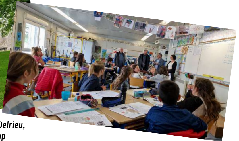
Le 5 juin - Visite de M. Serge Delrieu, Sous Préfet de Guingamp