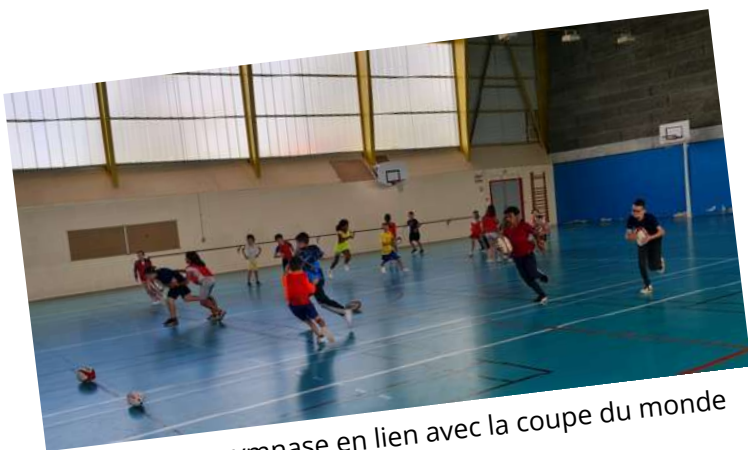
Rugby au gymnase en lien avec la coupe du monde

Les élèves sont également inscrits à un concours d'écriture : « On va en faire toute une histoire », avec Aurélie Valognes sur le thème des Jeux Olympiques 2024.